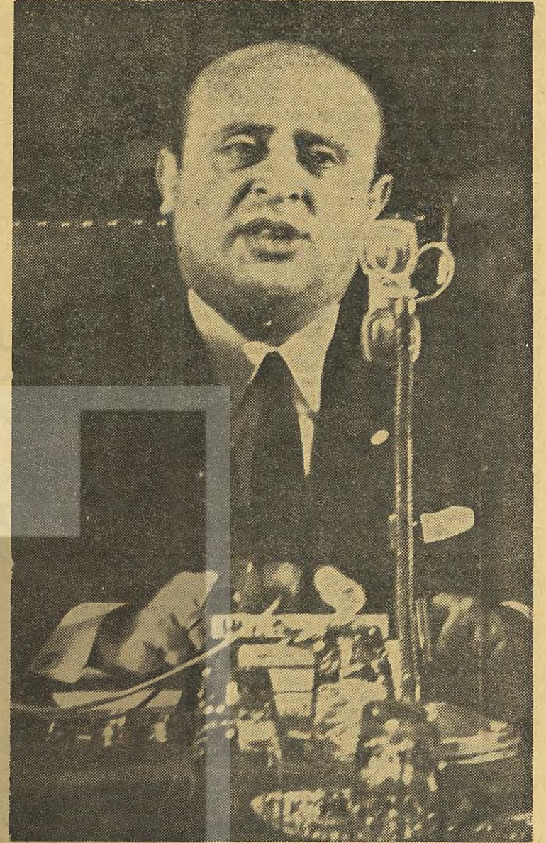
Başbakan DEMİREL, BASIN TOPLANTISINDA Lâf yuvarlama tâlimi!...

AP iktidarı bu yolu bıraktı ve başbaşa konuşmanın çaresini aradı. Acele bir neticeye varmak isteyen hükümet için böyle bir tecrübeye katlanmanın belki değeri de olabirdi. Fakat artık