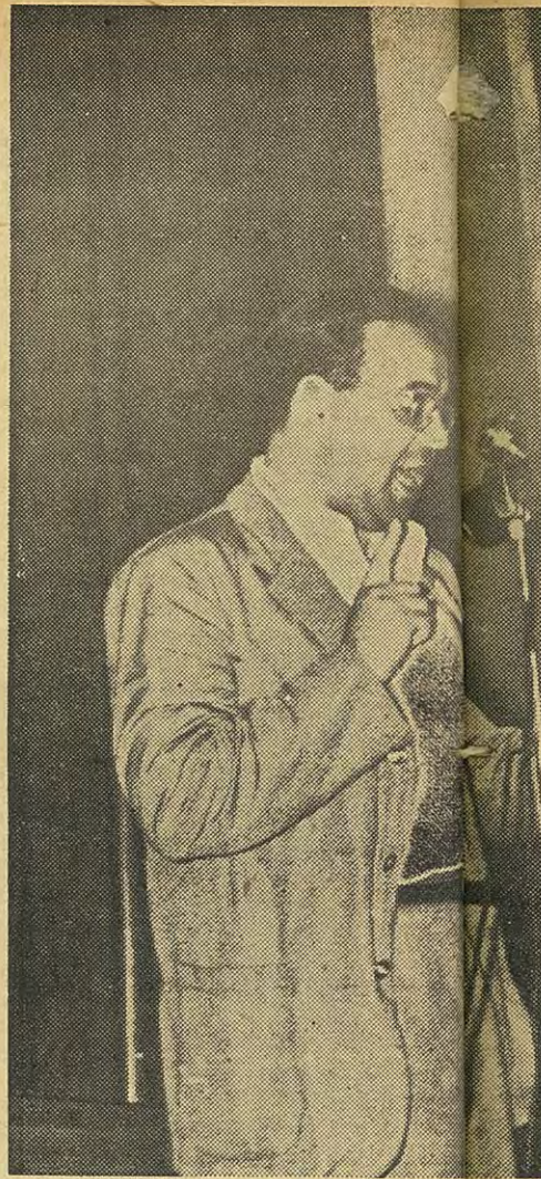
Irving Brown, bir toplantıda

Genellikle dostluk gösteren Kanadalılar bile karşı tarafa geçti. Meany onların yönetim kurulunda alacakları sandalya sayısını konusunda ateşli bir tartışmaya girişince araları açıldı. Yaptığı önerilerde kendi delegelerinden bazılarının oyunu bile alamadı Meany. İki Tunus delegesinden hangisine yer verileceği gibi nisbeten önemsiz bir konuda Reuther çoğunlukla birlikte Meany'ye karşı oy kullandı.